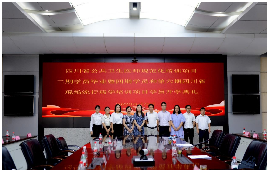
领导与第二期公卫规培毕业学员合影