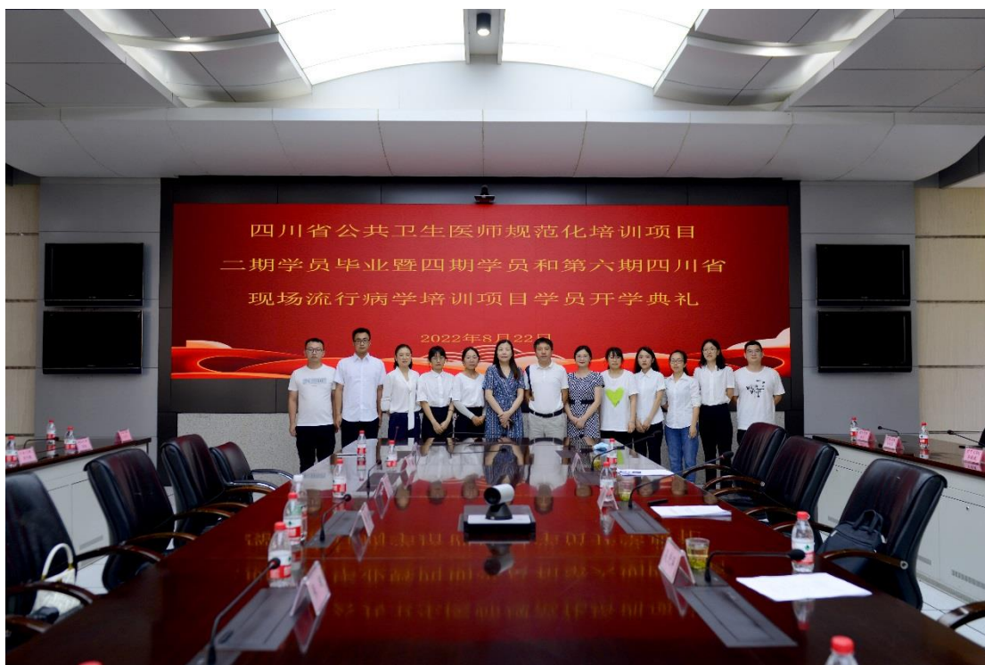
领导与第四期公卫规培新进学员合影