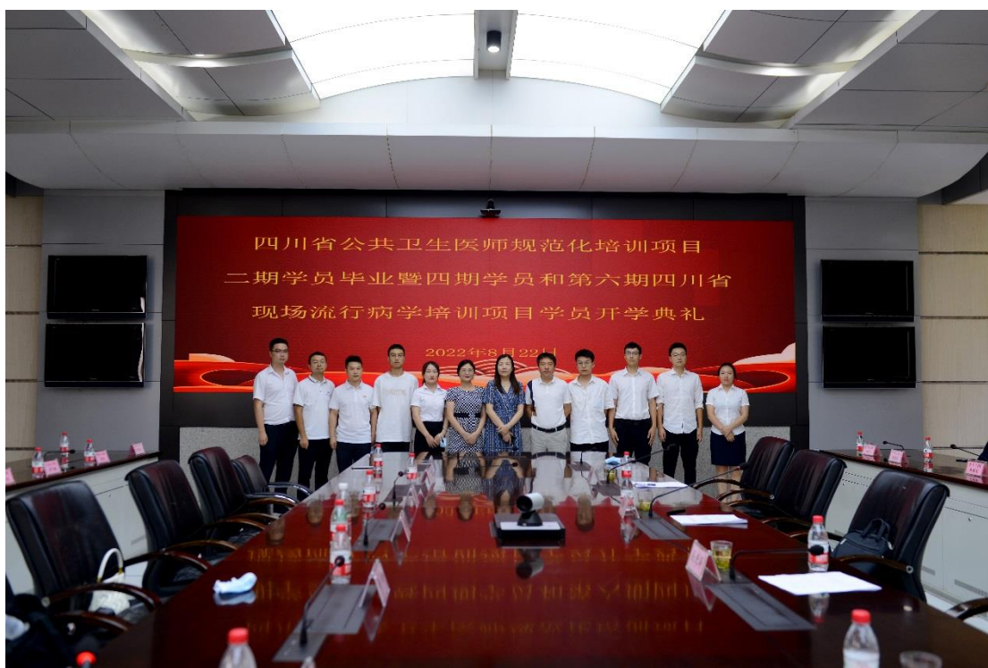
领导与第六期四川省现场流行病学培训项目学员合影